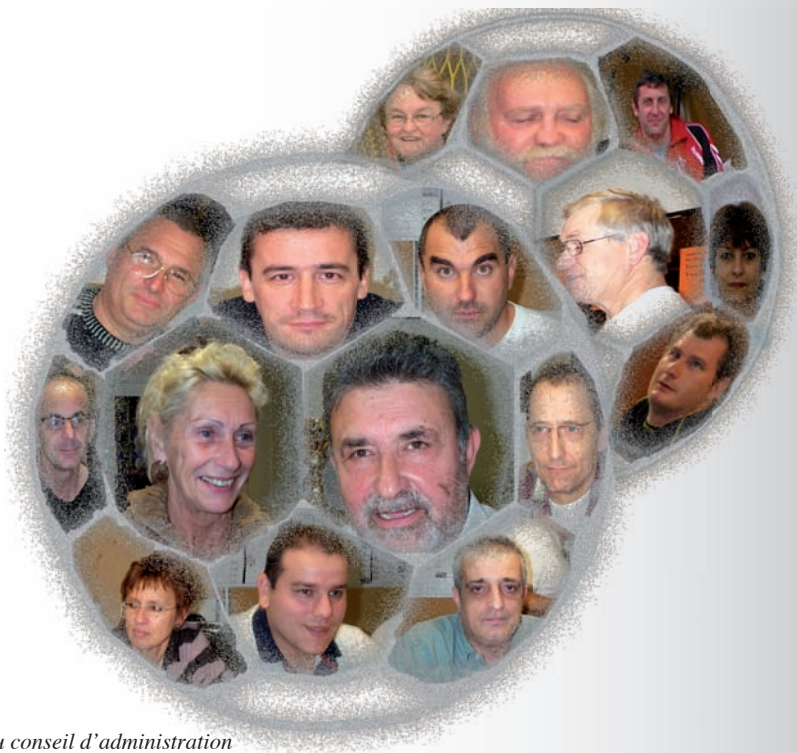
Les membres du conseil d'administration