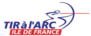
TABLEAU DE DUELS REGIONAL FITA DRAVEIL 2009