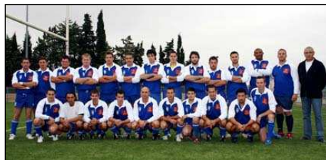
En haut l'équipe 1, en bas la réserve.

Vivement dimanche qu'on en apprenne un peu plus !