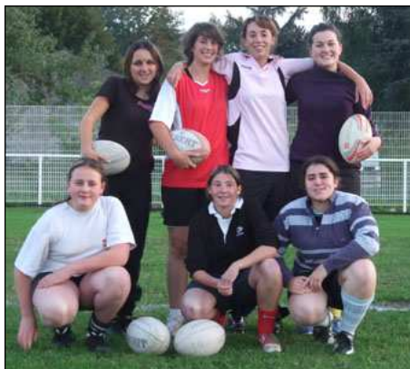
Quelques unes de nos cadettes (ci-dessus, bien sûr ...)